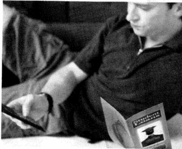
Une aide financière de l'Etat est souvent ardue à obtenir.

» Sondage Ecole écolo » www.20minutes.ch